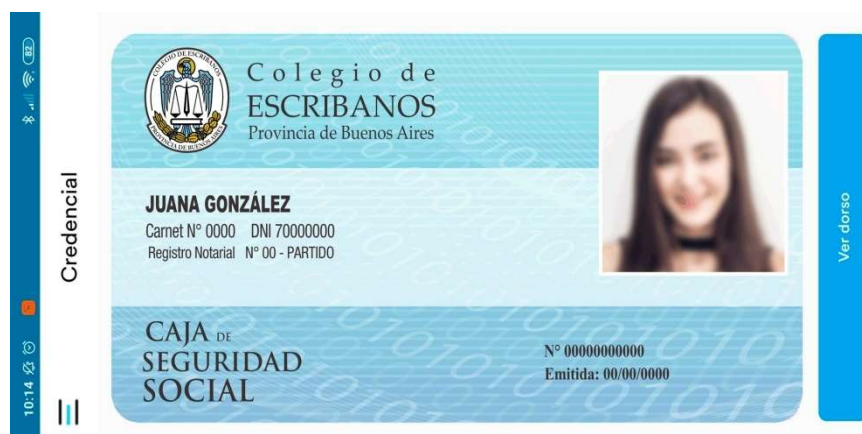
Imagen del frente de la credencial única

Mediante esta opción en menú principal o desde inicio se accede a la versión digital de la credencial única.