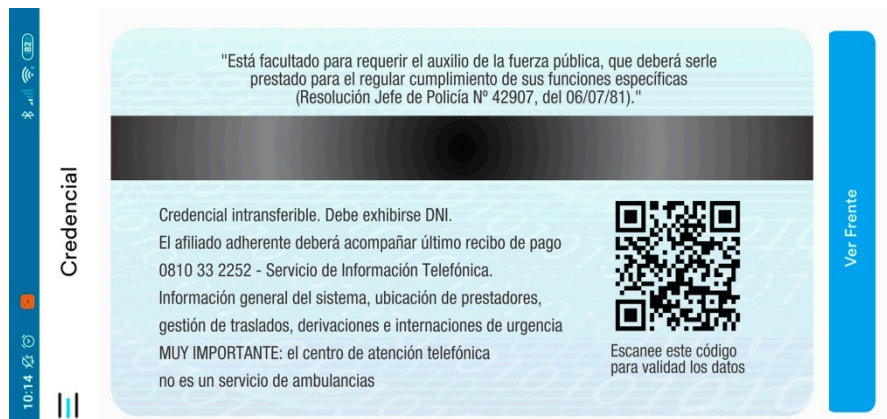
Imagen del dorso de la credencial única

IMPORTANTE: La credencial reflejará la foto que hemos obtenido durante la configuración o bien la última fotografía que en su reemplazo se hubiere obtenido previamente a su verificación por el Colegio. Debajo de la fotografía surgirá un mensaje de advertencia que indicará que la misma no se encuentra verificada. Este mensaje desaparecerá una vez que la fotografía haya sido verificada por la Institución, de modo tal que hasta que ello ocurra deberá exhibirse la credencial junto con el DNI de su portador.