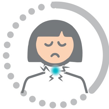
Dolor de garganta